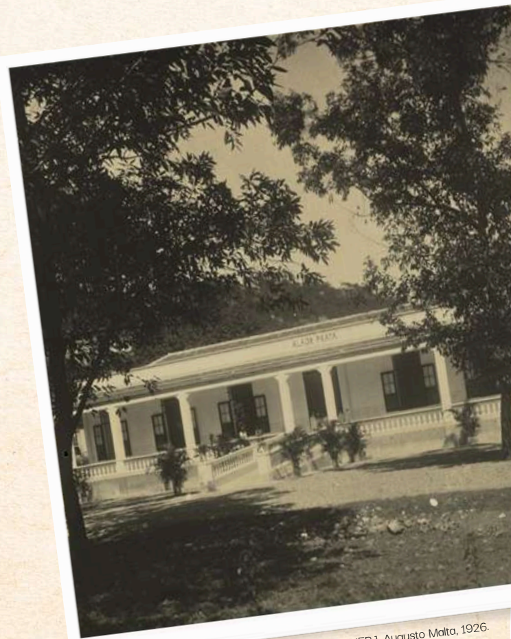
Pavilhão Alcor Prata (atual Casa da Ciência-UFRJ), Augusto Malta, 1926. Acervo: Museu da Imagem e do Som