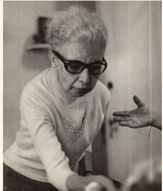
Nise da Silveira, autor desconhecido, 1970. Acervo: Arquivo Nacional.

Assim, ao mergulharem nessa história, que se relaciona à história e a composição da própria cidade, você poderá convidá-los a “comparar eventos ocorridos simultaneamente no mesmo espaço e em espaços variados, e eventos ocorridos em tempos diferentes no mesmo espaço e em espaços variados” (Brasil, 2018; p. 357) e “(EF06GE01) comparar modificações das paisagens nos lugares de vivência e os usos desses lugares em diferentes tempos” (Brasil, 2018; p. 385).