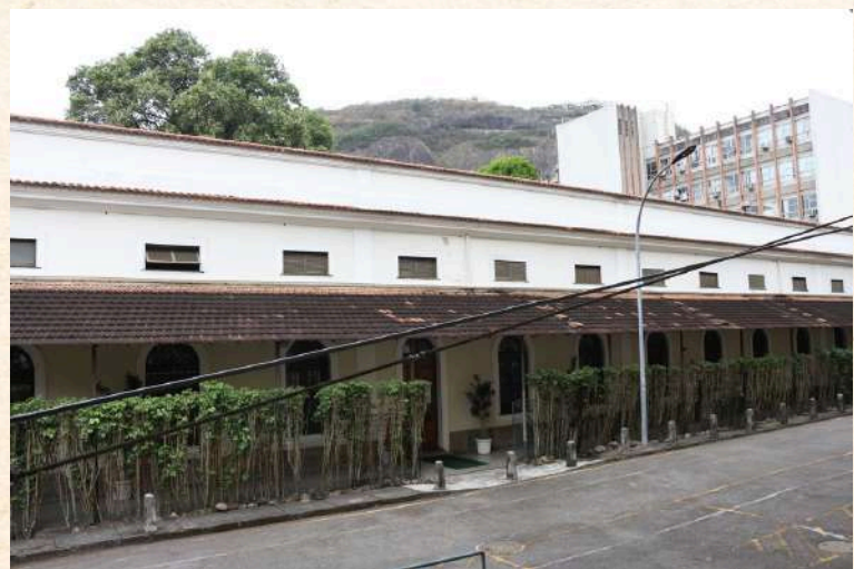
Fundação José Bonifácio (antigo Pavilhão das Imundas do Hospício Nacional de Alienados), Júlia Alves, 2022. Acervo: Centro de Memória Casa da Ciência.

Ainda nesse sentido, o conteúdo abordado durante o tour pode se configurar como uma oportunidade interessante para conversar sobre Saúde Pública e Saúde Coletiva. Que tal uma conversa sobre os Determinantes Sociais da Saúde (DSS)? Assim vocês poderão refletir sobre a saúde mental nesse contexto e como as políticas públicas e ações coletivas e individuais podem contribuir com ela.