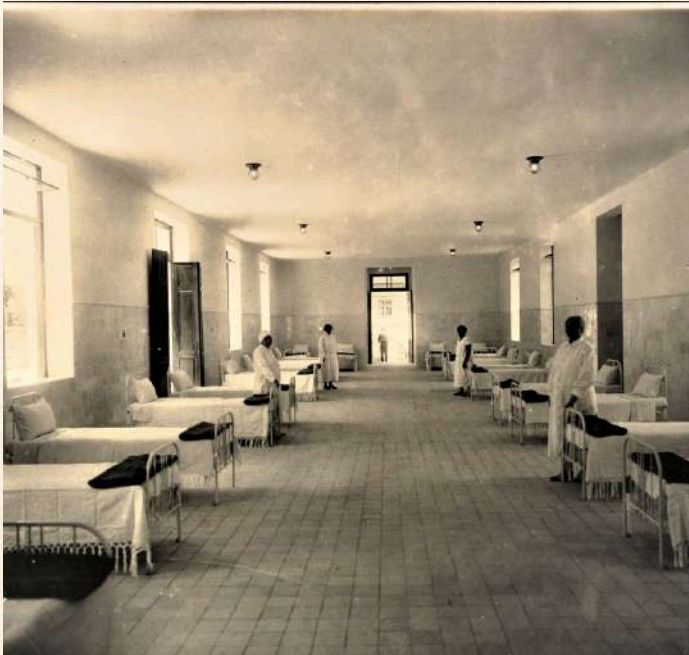
Interior do Pavilhão Alcor Prata (atual Casa da Ciência-UFRJ), Augusto Malta, 1926. Acervo: Museu da Imagem e do Som.

Para os estudantes do Ensino Médio, o Roteiro Caminhos da Loucura pode contribuir com reflexões sobre políticas públicas para a saúde, direitos humanos , discriminação e desigualdades sociais . Sobre isso, as competências específicas das Ciências Humanas para essa etapa de ensino, apresenta: